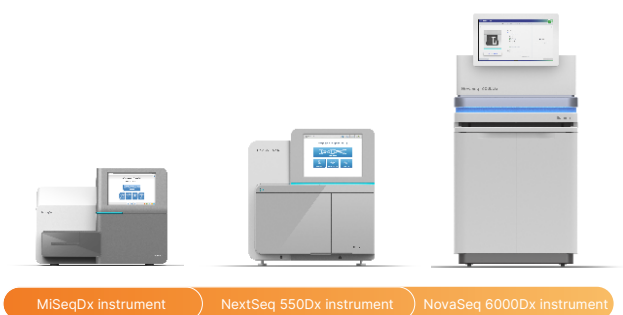
Figura 2: Rendimiento optimizado en plataformas validadas: estos instrumentos de DIV regulados por la FDA y con marcado CE ofrecen interfaces fáciles de usar, una seguridad mejorada y resultados de alta calidad para aplicaciones clínicas.

Illumina DNA Prep with Enrichment Dx es compatible con MiSeq™ Dx Instrument, NextSeq™ 550Dx Instrument y NovaSeq™ 6000Dx Instrument (figura 2).