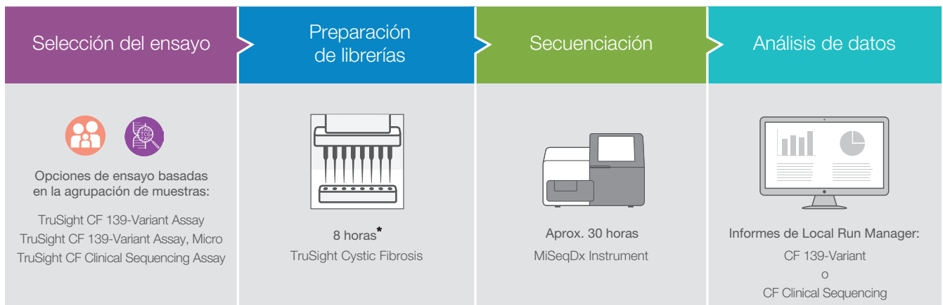
Figura 2: flujo de trabajo de TruSight Cystic Fibrosis. TruSight Cystic Fibrosis proporciona un flujo de trabajo optimizado e integrado que incluye la preparación de la librería, la secuenciación y análisis de datos, además de la creación de informes de los ensayos TruSight Cystic Fibrosis 139-Variant y TruSight Cystic Fibrosis Clinical Sequencing Assay.

*El tiempo de preparación de la librería depende de la productividad de muestras y puede ser distinto.