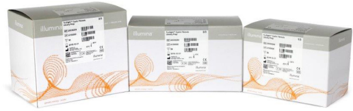
Figura 1: TruSight Cystic Fibrosis. TruSight Cystic Fibrosis combina ensayos previos en un único kit para mejorar la versatilidad y la productividad de muestras.

TruSight Cystic Fibrosis combina los ensayos MiSeqDx Cystic Fibrosis 139-Variant Assay y MiSeqDx Cystic Fibrosis Clinical Sequencing Assay en un único kit para mejorar la versatilidad y la productividad de muestras con reactivos de secuenciación actualizados, a la vez que mantiene el mismo flujo de trabajo, las especificaciones del producto y el rendimiento de los ensayos originales. Como parte de la integración en TruSight Cystic Fibrosis, los nombres de los ensayos se han cambiado a TruSight Cystic Fibrosis 139-Variant Assay y TruSight Cystic Fibrosis Clinical Sequencing Assay.