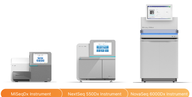
Abbildung 2: Optimiert für validierte Plattformen: Die von der FDA zugelassenen IVD-Geräte mit CE-Kennzeichnung zeichnen sich in klinischen Anwendungen durch anwenderfreundliche Benutzeroberflächen, hohe Sicherheit und Ergebnisse von hoher Qualität aus.

Illumina DNA Prep with Enrichment Dx ist mit dem MiSeq™ Dx Instrument, dem NextSeq™ 550Dx Instrument und dem NovaSeq™ 6000Dx Instrument kompatibel (Abbildung 2).