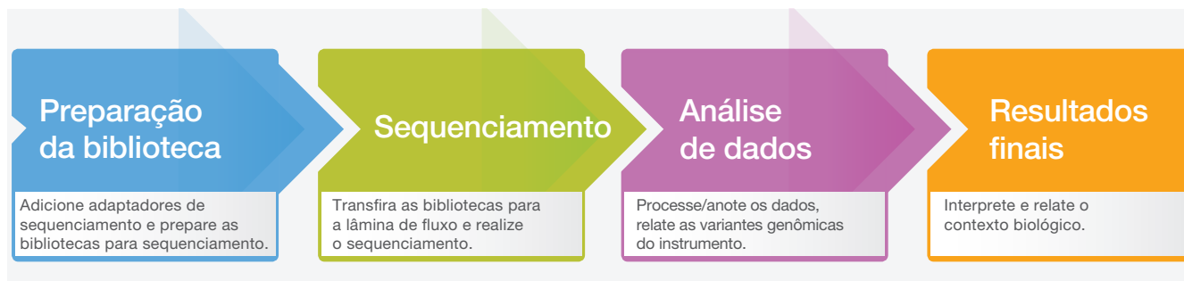
Figura 2: Fluxo de trabalho do MiSeq System: o fluxo de trabalho simplificado do MiSeq System permite um tempo rápido de resposta para sequenciamentos de bancada de última geração. As bibliotecas podem ser preparadas com qualquer kit de preparação de bibliotecas compatível. O tempo de sequenciamento de cinco horas e meia inclui clusterização, sequenciamento e identificação de bases com pontuação de qualidade com leitura em superfície dupla para uma execução de 2 × 25 pares de base em um MiSeq System com MiSeq Control Software.

Para a obtenção de resultados em poucas horas e não em alguns dias, a combinação da preparação rápida das bibliotecas com o MiSeq System proporciona um tempo de resposta simples e rápido (Figura 2). Prepare sua