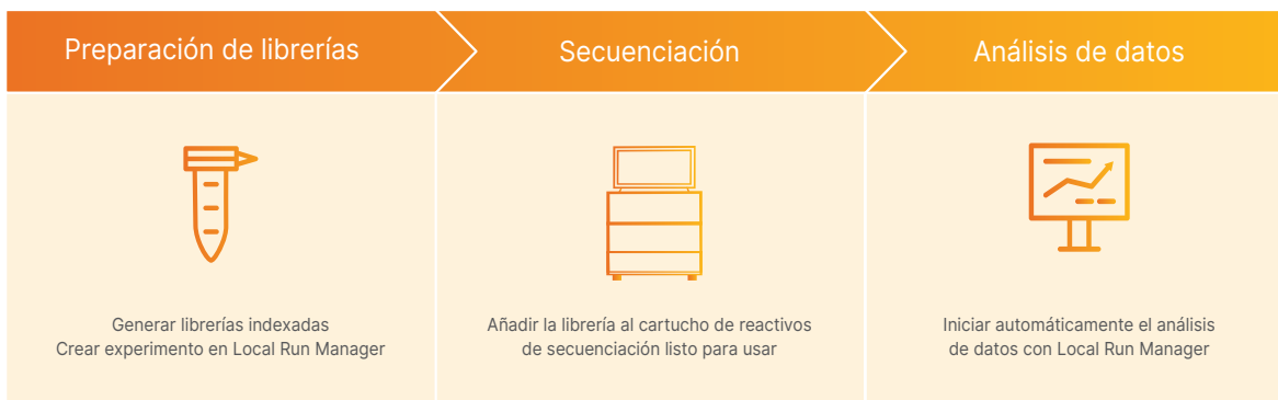
Figura 2: iSeq 100 System forma parte de un flujo de trabajo optimizado de ADN a datos.

iSeq 100 System forma parte de un flujo de trabajo optimizado en tres pasos que incluye la preparación de librerías, la secuenciación y el análisis de los datos (figura 2).