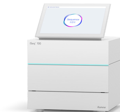
Figura 1: iSeq 100 System. Aproveche la potencia de la secuenciación de nueva generación (NGS, next-generation sequencing) en el sistema de secuenciación de sobremesa más compacto y asequible de la gama de soluciones de Illumina.