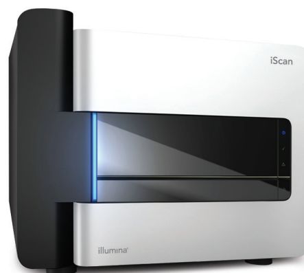
Figura 1: Il sistema iScan: un sistema completamente automatizzato e compatibile con la robotica di caricamento automatizzato e con i sistemi di gestione delle informazioni del laboratorio (LIMS) che offre una soluzione per la scansione robusta e a elevata processività.

Con un rapporto segnale-rumore elevato, una sensibilità elevata, un basso limite di rilevamento e un'ampia gamma dinamica, il sistema iScan genera dati di qualità eccellente per l'uso in un'ampia gamma di studi per lo screening di biomarcatori o studi di convalida. Le percentuali di identificazione elevate (più del 99% con il saggio Infinium) permettono studi per lo screening della popolazione e analisi CNV a elevata risoluzione, rilevando accuratamente anche singoli cambiamenti del numero di copie. Il sistema iScan è ideale per lo screening veloce e accurato nel campo dell'agrigenomica o per studi di convalida per di malattie complesse. Grazie a misurazioni sensibili e a un'ampia gamma dinamica, il sistema offre inoltre prestazioni eccellenti per gli studi di profilazione della metilazione.