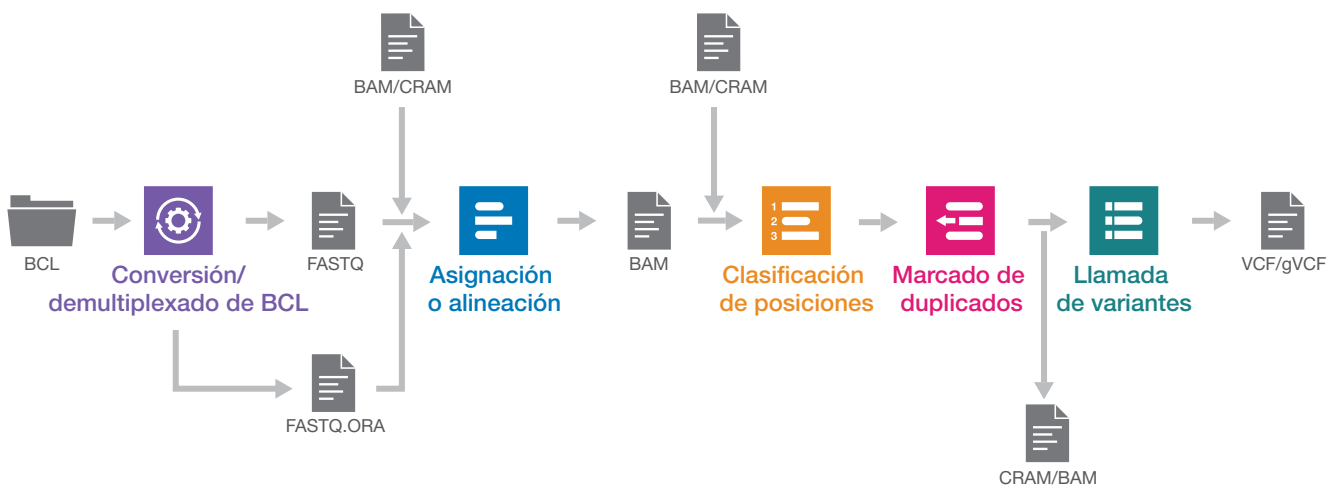
Figura 2: Flexibilidad de los procesos de DRAGEN. Cada proceso de DRAGEN contiene un juego específico de etapas para respaldar un análisis preciso y eficiente. El proceso de DRAGEN proporciona flexibilidad para aceptar diversos archivos de entrada y producir una amplia variedad de tipos de resultados, lo que permite a los usuarios personalizar su experiencia y generar el formato de archivo deseado.

DRAGEN Reference Builder, también conocido como tabla fragmentada, permite a los usuarios generar una referencia humana, no humana o no estándar. Las referencias creadas se pueden utilizar como entrada en todas las aplicaciones de DRAGEN compatibles con los archivos de referencia del cliente. La aplicación DRAGEN Reference Builder en BaseSpace™ Sequence Hub requiere un archivo FASTA. La mayoría de procesos de DRAGEN incluyen compatibilidad incorporada para hg19, hg38 (con o sin HLA), GRCh37 y Hs37d5. DRAGEN Graph Toolkit permite a los usuarios ampliar las capacidades de referencia de gráficos también a referencias de gráficos humanos más diversas.