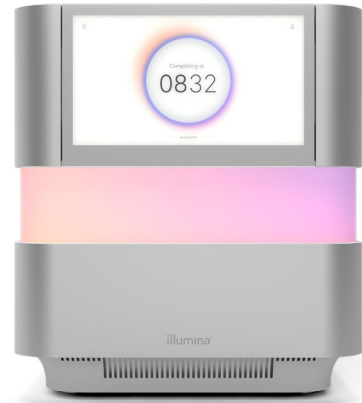
그림 1: NextSeq 2000 시스템 — 매우 광범위한 애플리케이션과 규모의 유연성을 지원하는 혁신적인 디자인 요소, 진보된 chemistry, 간소화된 바이오인포매틱스 및 직관적인 워크플로우를 제공하는 벤치탑 시퀀싱 시스템

NextSeq 1000 및 NextSeq 2000 시스템에는 이미 입증된 Illumina의 표준 SBS chemistry를 기반으로 하며 더 우수한 속도와 품질을 제공하는 강력한 XLEAP-SBS chemistry가 적용되었습니다. XLEAP-SBS 뉴클레오티드(nucleotide)는 내열성이 더 뛰어난 최첨단 염료, 새로운 링커(linker) 및 블록(block)을 사용하며, 가수분해(hydrolysis)가 50배 감소되고 블록 절단(block cleavage) 속도는 2.5배 빨라져 페이징(phasing) 및 프리페이징(prephasing)이 줄었습니다. 또 XLEAP-SBS 중합효소(polymerase)는 뉴클레오티드를 전보다 훨씬 더 빠르고 높은 충실도(fidelity)로 결합할 수 있도록 설계되었습니다.