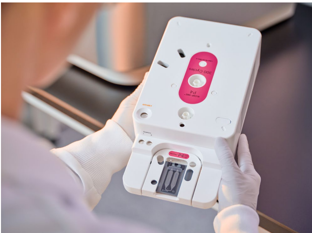
그림 3: NextSeq 1000 및 NextSeq 2000 시약 카트리지 — 시약, 유체, 폐기물 홀더가 포함되어 있어 시약 카트리지를 해동한 후 플로우 셀을 해동된 카트리지에 삽입하고 카트리지에 라이브러리를 로딩한 다음 조립한 카트리지를 기기에 장착하기만 하면 되는 통합된 카트리지

기기가 dry instrument로 설계되어 있고 시약은 항상 카트리지에 들어 있기 때문에 별도의 워시(wash)가 필요하지 않습니다. 따라서 기기 유지 관리 절차가 간소하고 기기 효율성이 최적화되어 있습니다.