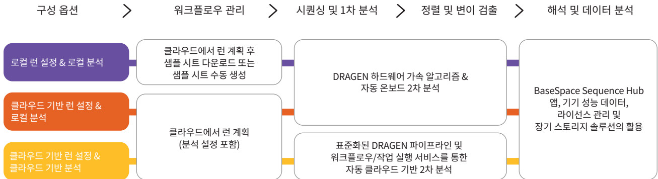
그림 4: 유연한 인포매틱스 제품군 — 연구자가 로컬 또는 클라우드 기반 런 설정, 런 관리, 데이터 분석 옵션을 선택해 원하는 대로 시퀀싱을 수행할 수 있도록 해 주는 NextSeq 1000 및 NextSeq 2000 시스템