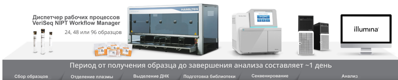
Рисунок 1. Полный рабочий процесс НИПТ для диагностики in vitro : при проведении тестирования с использованием метода VeriSeq NIPT Solution v2 предусмотрено все необходимое для НИПТ с использованием NGS, включая реагенты для выделения ДНК, подготовки библиотек и секвенирования; средства для автоматизации подготовки библиотек и секвенирования с помощью программного диспетчера рабочих процессов; локальный сервер для надежного хранения и анализа данных; а также программное обеспечение анализа данных с возможностью создания отчетов, представляющих качественные результаты.

Метод VeriSeq NIPT Solution v2 очень эффективен, поскольку отличается достоверностью результатов, высокой скоростью их получения и низкой частотой ошибок.