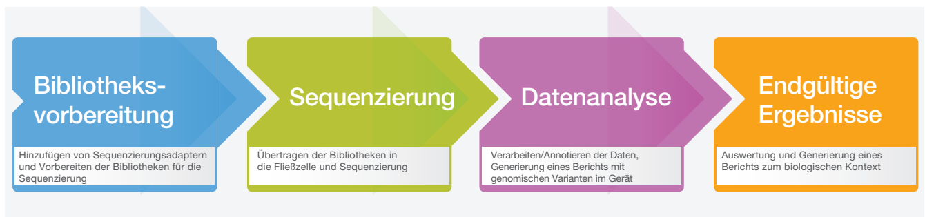
Abbildung 2: Workflow des MiSeq-Systems: Der optimierte Workflow des MiSeq-Systems ermöglicht NGS-Sequenzierung auf einem Tischgerät mit kurzen Durchlaufzeiten. Bibliotheken können mit jedem kompatiblen Bibliotheksvorbereitungskit vorbereitet werden. Die Sequenzierungsdauer von 5,5 Stunden umfasst Clusterbildung, Sequenzierung und qualitativ benotetes Base-Calling mit Scan von zwei Oberflächen für einen Lauf mit 2 × 25 Basenpaaren auf einem MiSeq-System mit MiSeq Control Software.

Alle MiSeq-Systeme ermöglichen die Datenanalyse im Gerät sowie Zugriff auf BaseSpace™ Sequence Hub, die Plattform für Genomik-Cloud-Computing von Illumina. BaseSpace Sequence Hub ermöglicht den Upload von Daten in Echtzeit, bietet einfache Datenanalysetools, Laufüberwachung über das Internet sowie eine sichere, skalierbare Speicherlösung. Eine Suite mit Datenanalysetools sowie eine wachsende Anzahl Analyse-Apps von Drittanbietern ermöglichen Forschern die Nutzung eigener Informatiklösungen. Außerdem ermöglicht BaseSpace Sequence Hub die schnelle und einfache Freigabe von Daten für Kollegen und Kunden.