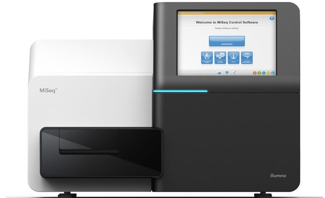
Abbildung 1: MiSeq-System: Das kompakte MiSeq-System eignet sich bestens für die schnelle, kostengünstige Sequenzierung der nächsten Generation.

Beim MiSeq-System handelt es sich um die erste DNA-zu-Daten-Sequenzierungsplattform, die Clusterbildung, Amplifikation, Sequenzierung und Datenanalyse in einem Gerät vereint. Dank des geringen Platzbedarfs (ca. 0,19 Quadratmeter) eignet sich das System für praktisch jede Laborumgebung ( Abbildung 1 ). Das MiSeq-System nutzt SBS-Chemie (Sequencing by Synthesis, Sequenzierung durch Synthese) von Illumina, eine bewährte NGS-Sequenzierungstechnologie (Next-Generation Sequencing, Sequenzierung der nächsten Generation), mit der mehr als 90 % der weltweiten Sequenzierungsdaten generiert werden. 1 Mit der Leistung von NGS und seinen kompakten Abmessungen ist das MiSeq-System die ideale Plattform für die schnelle und kostengünstige Genanalyse.