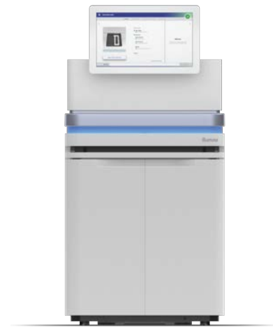
Figura 1: O sistema NovaSeq 6000 – Transformando o sequenciamento combinando produtividade, flexibilidade e facilidade de uso para praticamente qualquer método, genoma e escala.

O sistema NovaSeq 6000 oferece acesso a uma poderosa solução de genômica de alta produtividade que capacita os