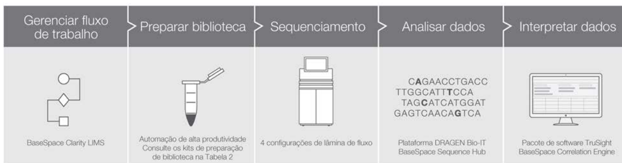
Figura 4: O sistema NovaSeq 6000 faz parte de um fluxo de trabalho de sequenciamento abrangente – O sistema NovaSeq 6000 é compatível com o BaseSpace Clarity LIMS, com o portfólio de kits de preparação de bibliotecas Illumina, com o suporte a métodos qualificados da Illumina, com soluções de análise de dados, como a plataforma o DRAGEN Bio-IT e o BaseSpace Sequence Hub, e com ferramentas de interpretação posterior de dados, como o pacote de software TruSight e o BaseSpace Correlation Engine.