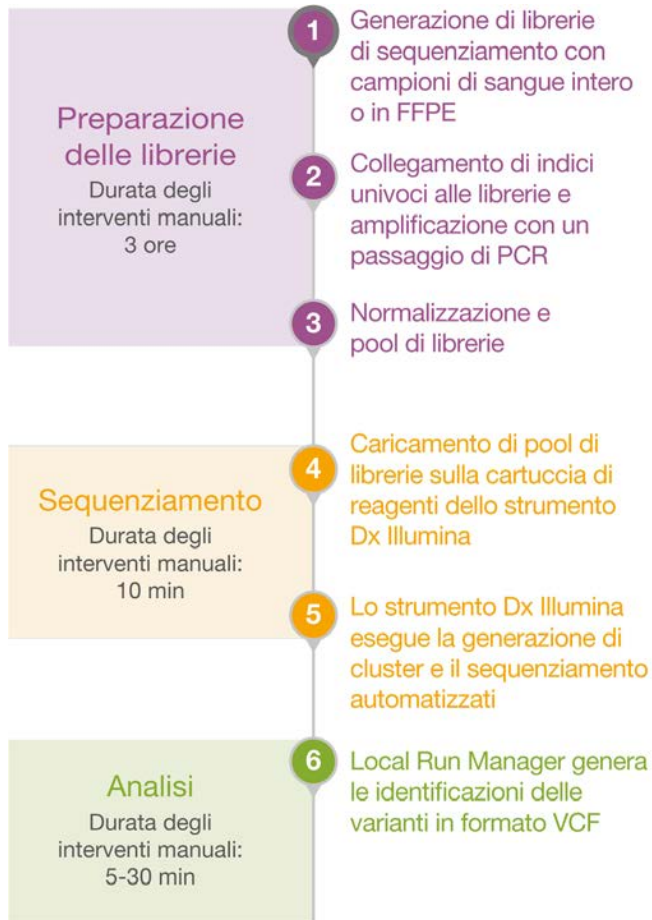
Figura 2: Flusso di lavoro ottimizzato per il saggio personalizzato: il flusso di lavoro di TruSeq Custom Amplicon Kit Dx fornisce i dati dal DNA grazie a una procedura ottimizzata in sei fasi.

TruSeq Custom Amplicon Kit Dx produce librerie pronte per il sequenziamento che possono essere caricate su uno strumento di sequenziamento Dx Illumina per la generazione di dati di sequenziamento affidabili in meno di due giorni.