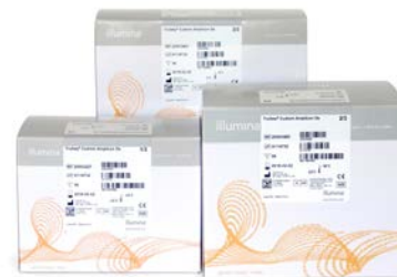
Figura 1: TruSeq Custom Amplicon Kit Dx: TruSeq Custom Amplicon Kit Dx, regolamentato dall'FDA e dotato di marcatura CE-IVD, fornisce i reagenti per la preparazione delle librerie che consentono ai laboratori di sviluppare i propri test diagnostici da utilizzare sugli strumenti di sequenziamento Dx Illumina.

Le specifiche dei target (Tabella 1) supportano il sequenziamento superiore al 90% di esoni in RefSeq, 1 in base alla progettazione del saggio. La possibilità di personalizzare la configurazione del kit offre inoltre la flessibilità per il rendimento dei campioni.