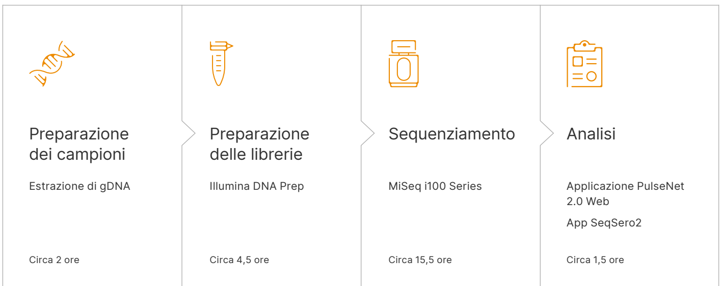
Figura 1: flusso di lavoro NGS end-to-end per il rilevamento della salmonella

Questa nota sull'applicazione dimostra il rilevamento e la caratterizzazione accurati di un ceppo persistente di Salmonella enterica sierotipo Infantis multifarmaco-resistente ( REP JFX01 ) utilizzando un efficiente flusso di lavoro NGS che integra Illumina DNA Prep, MiSeq i100 Series e strumenti di analisi di terze parti ( Figura 1 ).