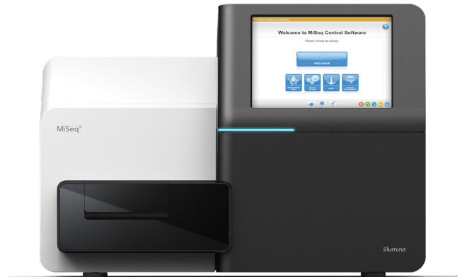
Abbildung 1: MiSeq System: Das kompakte MiSeq System eignet sich bestens für die schnelle, kostengünstige Sequenzierung der nächsten Generation.

Beim MiSeq System handelt es sich um die erste DNA-zu-Daten-Sequenzierungsplattform, die Clusterbildung, Amplifikation, Sequenzierung und Datenanalyse in einem Gerät vereint. Dank des geringen Platzbedarfs (ca. 0,19 Quadratmeter) eignet sich das System für praktisch jede Laborumgebung (Abbildung 1). Das MiSeq System nutzt SBS-Chemie (Sequencing by Synthesis, Sequenzierung durch Synthese) von Illumina, eine bewährte NGS-Sequenzierungstechnologie (Next-Generation Sequencing, Sequenzierung der nächsten Generation), die in über 300.000 Publikationen mit Peer-Review angeführt wird (fünfmal häufiger als alle anderen NGS-Technologien zusammen). 1 Mit der Leistung von NGS und seinen kompakten Abmessungen ist das MiSeq System die ideale Plattform für die schnelle und kostengünstige Genanalyse.