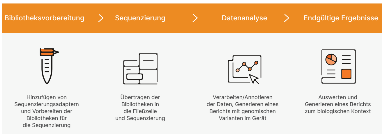
Abbildung 2: Workflow des MiSeq System: Der optimierte Workflow des MiSeq System ermöglicht NGS-Sequenzierung auf einem Tischgerät mit kurzen Durchlaufzeiten. Bibliotheken können mit jedem kompatiblen Bibliotheksvorbereitungskit vorbereitet werden. Die Sequenzierungsdauer von 5,5 Stunden umfasst Clusterbildung, Sequenzierung und qualitativ benotetes Base-Calling mit Scan von zwei Oberflächen für einen Lauf mit 2 × 25 Basenpaaren auf einem MiSeq System mit MiSeq Control Software.

ermöglicht die Datenanalyse im Gerät sowie Zugriff auf BaseSpace™ Sequence Hub, die Plattform für Genomik-Cloud-Computing von Illumina. BaseSpace Sequence Hub ermöglicht den Upload von Daten in Echtzeit, bietet einfache Datenanalysetools, Laufüberwachung über das Internet sowie eine sichere, skalierbare Speicherlösung. Eine Suite mit Datenanalysetools sowie eine wachsende Anzahl an Analyse-Apps von Drittanbietern ermöglichen Forschern die Nutzung eigener Informatiklösungen. Außerdem ermöglicht BaseSpace Sequence Hub die schnelle und einfache Freigabe von Daten für Kollegen und Kunden.