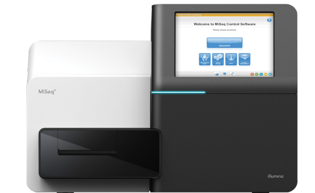
Figure 1 : MiSeq System – MiSeq System compact est bien adapté au séquençage nouvelle génération rapide et rentable.

MiSeq System offre la première plateforme de séquençage de l'ADN aux données intégrant la génération d'amplifiats, l'amplification, le séquençage et l'analyse des données dans un seul instrument. Son faible encombrement, d'environ 0,18 m 2 (2 pi 2 ), lui permet de s'intégrer facilement dans pratiquement n'importe quel environnement de laboratoire (figure 1). MiSeq System s'appuie sur la chimie du séquençage par synthèse (SBS) d'Illumina, une technologie éprouvée de séquençage de nouvelle génération (SNG) citée dans plus de 300 000 publications évaluées par les pairs, soit 5 fois plus que toutes les autres technologies de séquençage de nouvelle génération (SNG) combinées 1 . Avec la puissance du SNG dans un format compact, MiSeq System est la plateforme idéale pour une analyse génétique rapide et rentable.