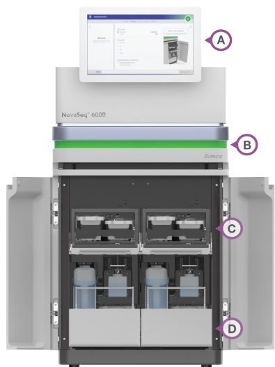
Figura 3: Un funcionamiento más sencillo. Muchas características de NovaSeq 6000 System se han diseñado para simplificar los estudios genómicos; algunas de ellas son: (A) una interfaz de pantalla táctil intuitiva, (B) una pantalla LED iluminada que indica el estado de la celda de flujo, (C) unos cartuchos encajables que contienen reactivos listos para usar y (D) un contenedor de residuos que se retira fácilmente para desecharlo.