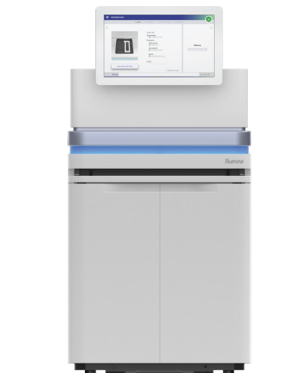
Figura 1: NovaSeq 6000 System. Transforma la secuenciación al aunar productividad, flexibilidad y facilidad de uso con prácticamente cualquier método, genoma y magnitud.

NovaSeq 6000 System ofrece un rendimiento de hasta 6 Tb y 20 000 millones de lecturas por experimento S4 dual en menos de 2 días. Su variedad de combinaciones de longitud de lectura y tipos de celda de flujo ofrece configuraciones de rendimiento y duración del experimento flexibles según las necesidades del proyecto (tabla 1). Las celdas de flujo NovaSeq S Prime (SP), S1 y S2 le ofrecen una secuenciación rápida y potente en la mayoría de las aplicaciones que exigen una productividad elevada.