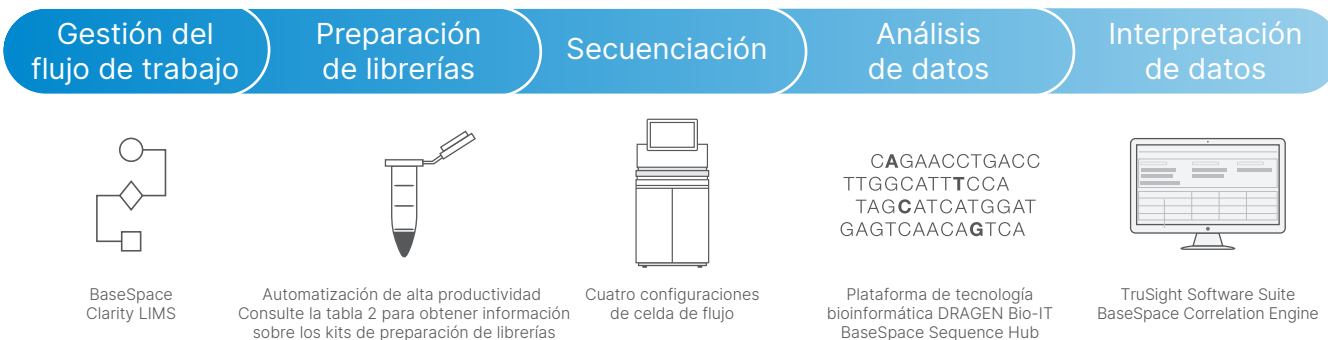
Figura 4: Flujo de trabajo de NGS de NovaSeq 6000 System. NovaSeq 6000 System es compatible con BaseSpace Clarity LIMS, la gama de kits de preparación de librerías de Illumina, los métodos acreditados por Illumina, las soluciones de análisis de datos, como la plataforma de tecnología bioinformática DRAGEN y BaseSpace Sequence Hub, y las herramientas sucesivas de interpretación de datos, como TruSight Software Suite y BaseSpace Correlation Engine.

Para facilitar la interpretación de datos, Illumina ofrece TruSight™ Software Suite y BaseSpace Correlation Engine. TruSight Software Suite proporciona herramientas completas e intuitivas para visualizar, clasificar e interpretar variantes asociadas a enfermedades genéticas. Por otro lado, BaseSpace Correlation Engine integra los datos con la base de conocimientos genómicos del mundo para compararlos en un gran repositorio depurado de conjuntos de datos públicos.