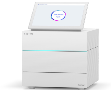
Abbildung 1: iSeq 100 System: Das iSeq 100 System ist das kompakteste NGS-Tischsystem von Illumina.