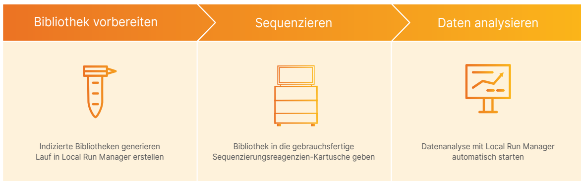
Abbildung 2: Das iSeq 100 System ist Teil eines optimierten Workflows von der DNA bis zu den Daten.

Das iSeq 100 System ist Teil eines optimierten Workflows mit den drei Schritten Bibliotheksvorbereitung, Sequenzierung und Datenanalyse (Abbildung 2).